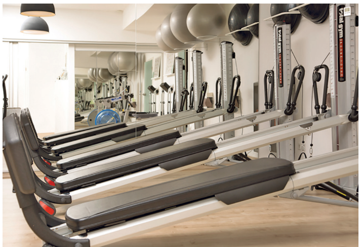
Auf der Trainingsfläche in der Praxis für Physiotherapie Leib & Seele stehen moderne Geräte bereit. Hier können die Patienten auf verschiedene Weise ihre Beweglichkeit trainieren und verbessern.

Die alten Praxisräume sollen indessen als Filiale erhalten bleiben. „Wir möchten dort ein Sportangebot etablieren und gerätegestütztes Training sowie Sportkurse anbieten, die als Selbstzahler oder per Verordnung wahrgenommen werden können.“ Geplant ist ein umfangreiches Kursprogramm, das nicht nur allen Störmedern zugute kommen soll. (ms)