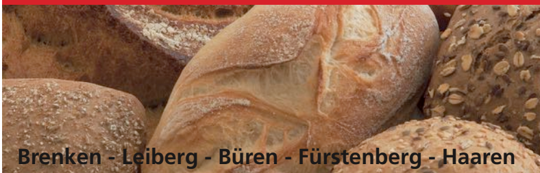
Brenken - Leiberg - Büren - Fürstenberg - Haaren