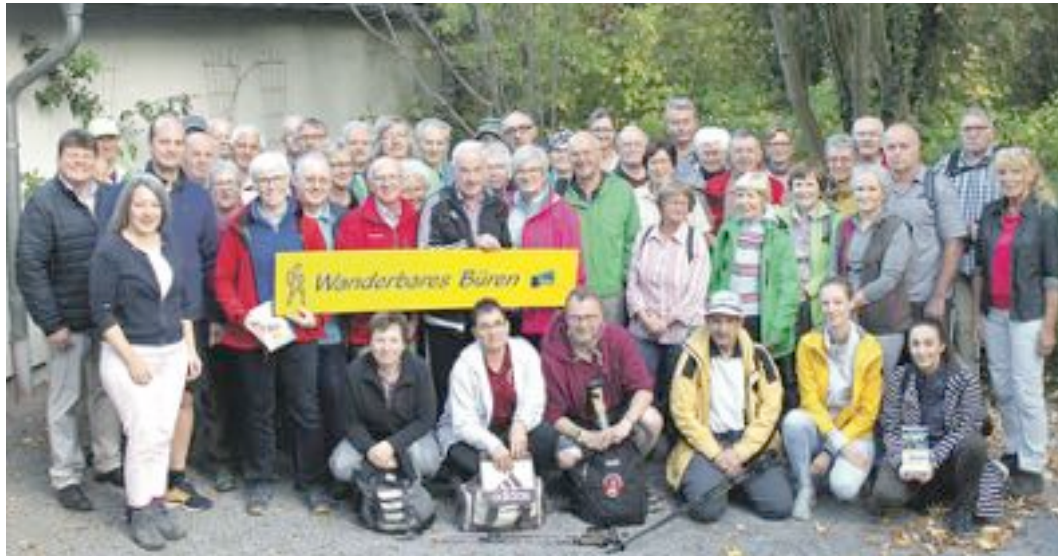
Einige Teilnehmer und Vertreter aus dem Team der Wanderführer und Organisatoren posierten gerne zu einem Erinnerungsfoto an eine wunderbar wanderbare Woche in Büren.

INFO-TEL: 0 52 51-28 08 15 www.twc-grebe.de