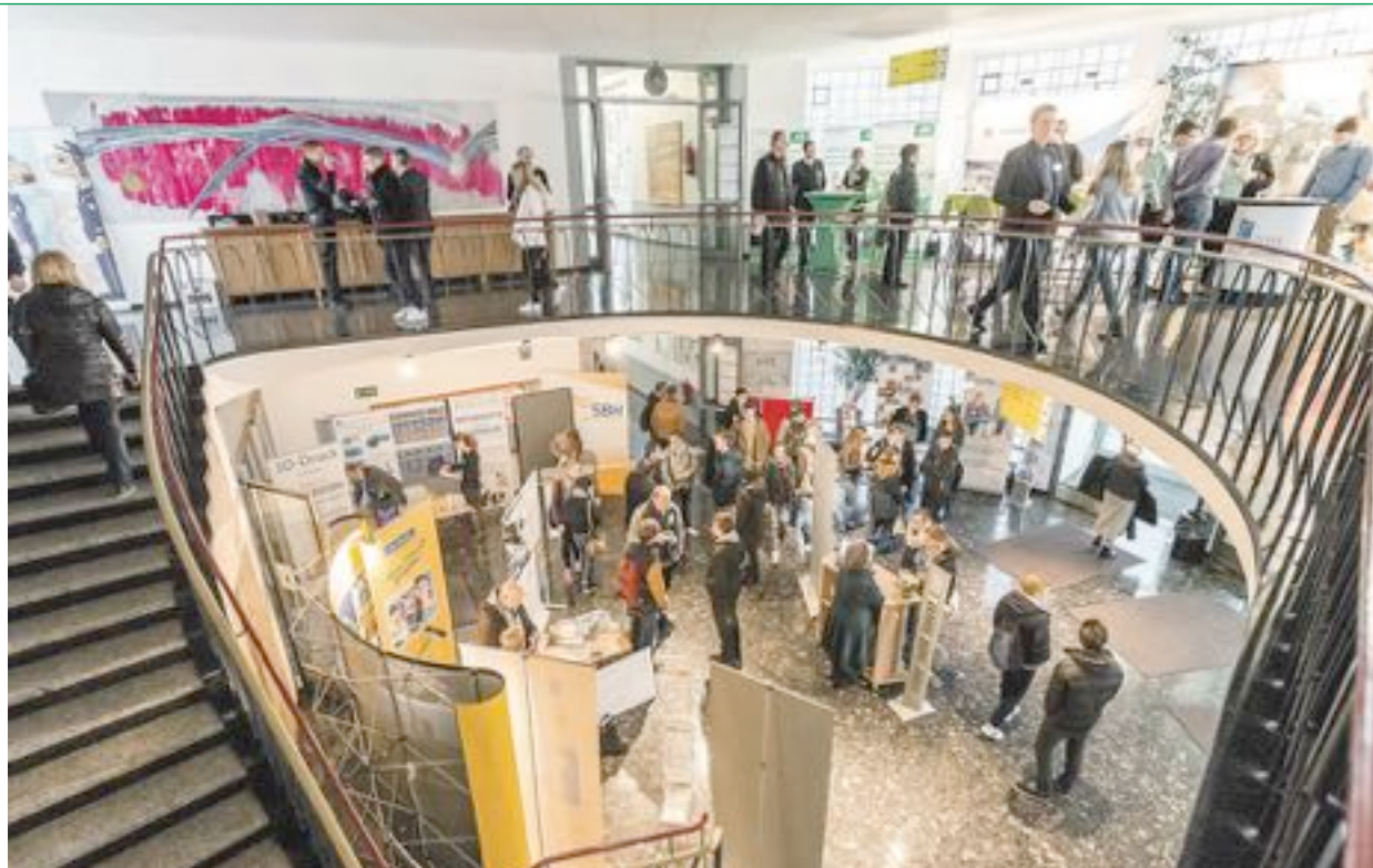
Volles Haus: In den Vorjahren besuchten rund 1.500 Interessierte die Bürener Ausbildungsmesse b.a.m.