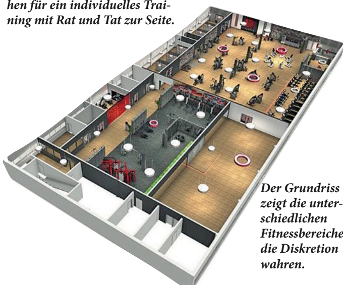
Der Grundriss zeigt die unterschiedlichen Fitnessbereiche, die Diskretion wahren.